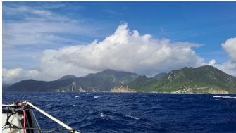
Von Martinique nach Dominica

zu ankern, eine Boje für 20,- Euro die Nacht nehmen. Eigentlich wollen wir nicht so lange bleiben, doch wir verlängern unseren Aufenthalt Tag um Tag. Am Abend kosten wir unsere Kakaofrucht und sammeln die Kakao-Bohnen zum Trocknen. Mal sehen, was wir daraus machen.