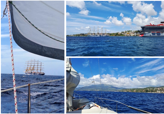
Segel setzen mit dem Großen - Mount Pelée

Nordwest Guadeloupe 🌍 16° 11,94N 061° 47,63W 📅 Mo 30.03.26 🕒 12:20 (18:20)* 🌧️ S 2-3 ☀️ bedeckt 🌡️ 26°C 🌊 0,3 🚢 Genua Raumschot 2,8 kn 🌀 Deshaies 🗣️ gesprochen Déhé (Kreol)