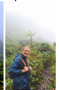
Mount Pelée - Steil, verregnet, nebligtes Erlebnis mit kurzem Durchblick 😊

Gute Fahrt, angenehmen Wind und freundliche See wünscht Silvi 😊 mit Hendrik ...by the winD