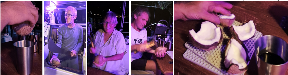
Kokosnuss öffnen mit verschiedenen Werkzeugen

mal mit seinem Werkzeug das Öffnen einer Kokosnuss.