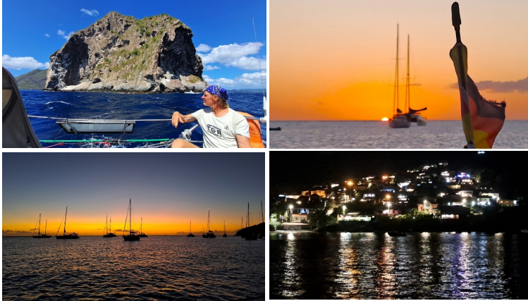
Dicht vorbei am Diamond's Rock bis in die Petite Anse d'Arlet

🌊 ESE – NW 0-4 🌤️ wolkig 🌡️ 26°C 🌬️ 0,5 🚤 segelnd 🌞 Anse à Galets, Réserve Cousteau