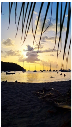
Grande Anse d'Arlet