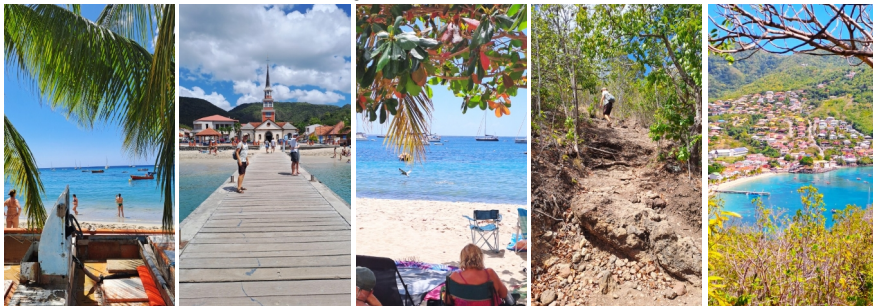
Rund um die Petite Anse d'Arlet

einen herrlichen Ausblick. Auch von Land aus gehe ich Schnorcheln. 🌊 🌞 🌈 Eine willkommene Abkühlung an diesem heißen Tage. Abends an Bord bei Fuchur mit Party-Licht probiert jeder