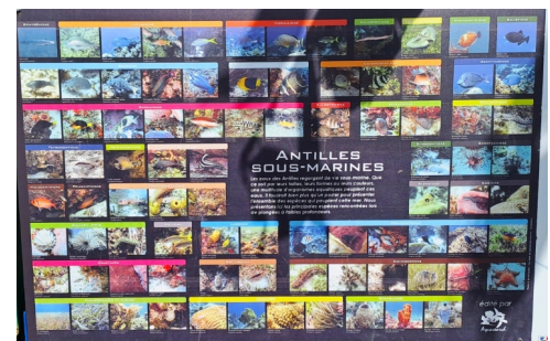
Fauna der karibischen Buchten

www.BoatLifeFeeling.de/BLogbuch/ 🚤 RONDÉE-ATLANTIQUE 🤪