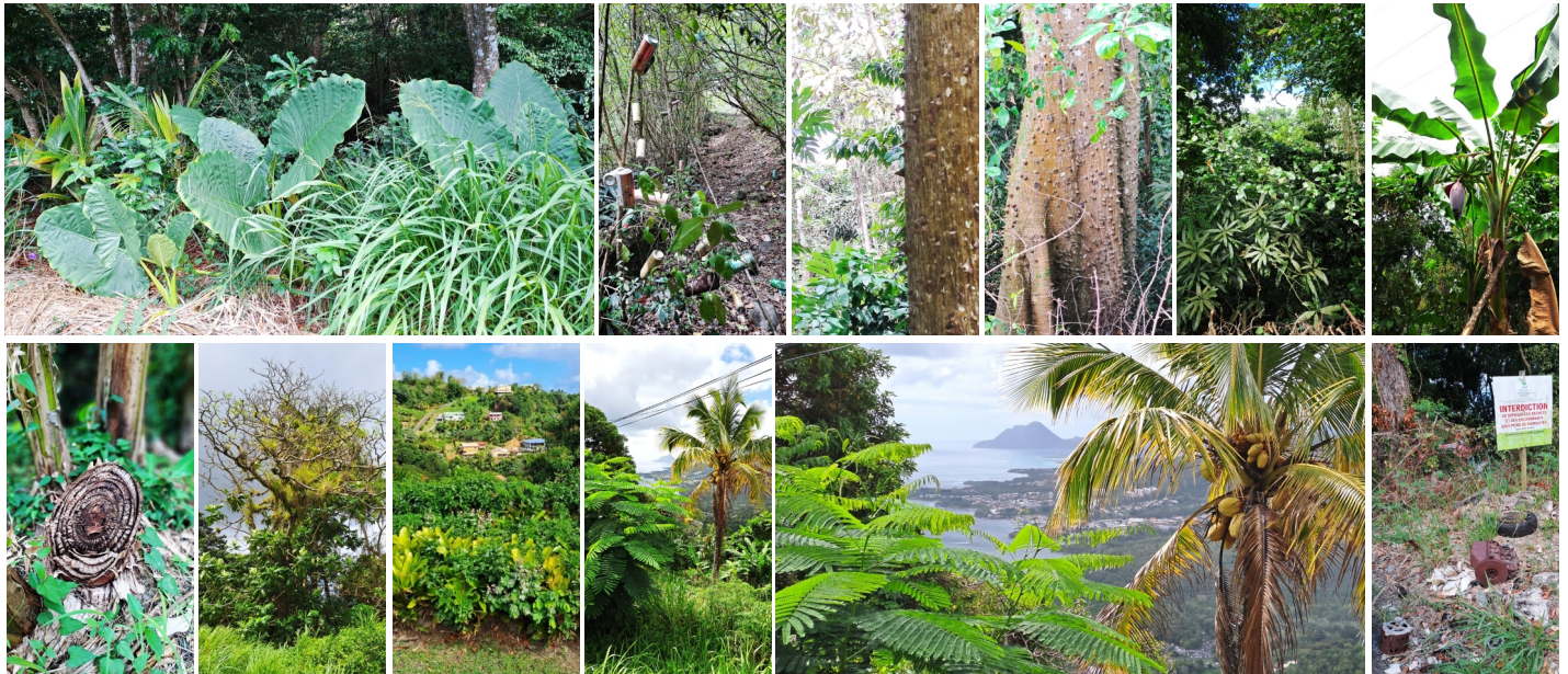
Üppige Vegetation und Zeichen der Zivilisation am Morne Gommier und Morne Aca Martinique

Mit Picknick Utensilien versorgt stapfen wir los Richtung Morne Gommier und Morne Aca. Dort werden wir von üppiger Vegetation so nah an der Stadt und auch von den Zeichen der Zivilisation überrascht. Noch im Tal bestaunen wir die riesigen Blätter am Wegesrand. Bergauf ist der Weg mit etlichen leeren Bierdosen „markiert“, als würde jemand täglich auf dem Heimweg sein Feierabendbier an den unterschiedlichen Stellen leeren!? Stachelige Bäume, dichter Urwald, Bananenstauden mit Innenleben, Schmarotzerpflanzen,