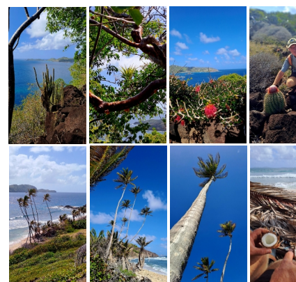
Flora und Palmen auf Petite Nevis