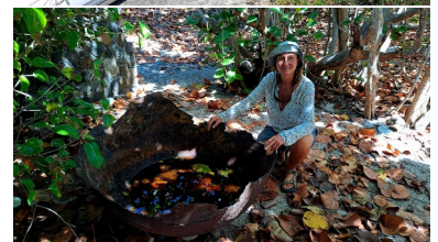
Walfängerinsel Petite Nevis