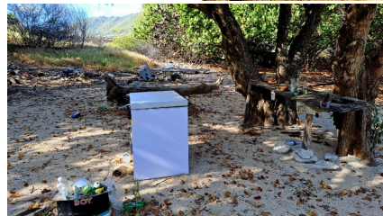
Meer und weniger schöner Unrat