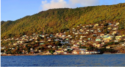
Von Bequia nach Petite Nevis

Wasserschildkröte, Plastikflaschen und kurios die Kühltruhe und Überreste der letzten wohl ausschweifenden Party. 😊