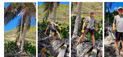
Kokosnussernte mit langer Stange

Wir verabschieden uns am Sonntag, den 01.02.2026 von Bequia nach der Erkundung einer kleine Höhle am Strand. Auf dem Seeweg zu den drei kleinen Inseln, die wir statt der Tobago Cays erkunden wollen, entdecken wir noch Höhlenbauten an der Küste Bequias. Und es geht ziemlich spannend durch eine sehr enge Durchfahrt zwischen Bequia und der kleinen westlich gelegenen Insel. Fasziniert bin ich auch mal wieder von der Farbenfreude der karibischen Ortschaften wie im Süden Bequias. 😊